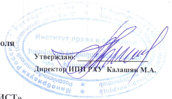
График 2-ого промежуточного контроля